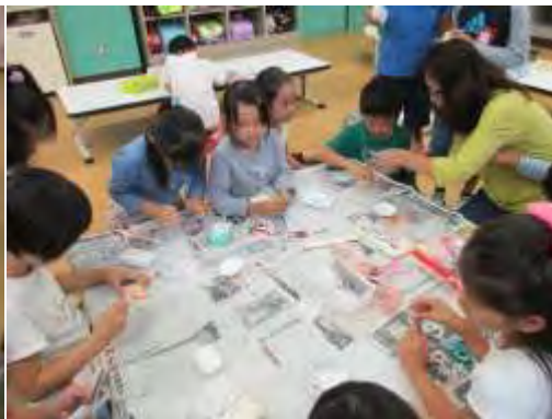
☆石けんデコパージュをつくろう!☆