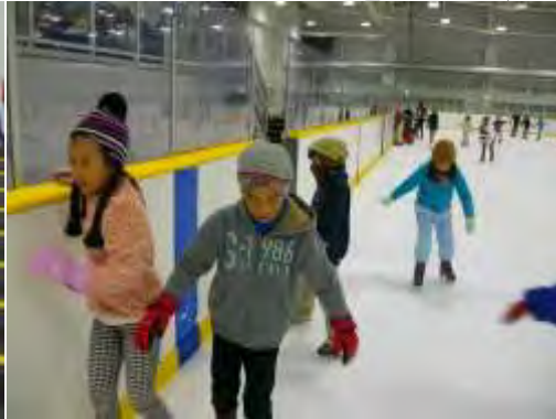
☆アイスアリーナへ行こう!☆