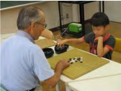
☆はっぴーくらぶさんと囲碁・将棋☆