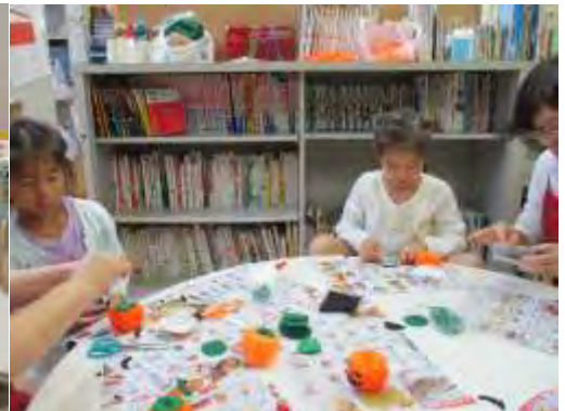
☆指あみでハロウィンのかぼちゃ☆