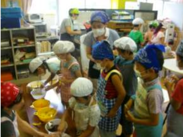
☆おやつ作り～フルーツポンチ～☆

★印のプログラムは事前申し込みが必要です。*プログラムは都合により変更になる場合もあります