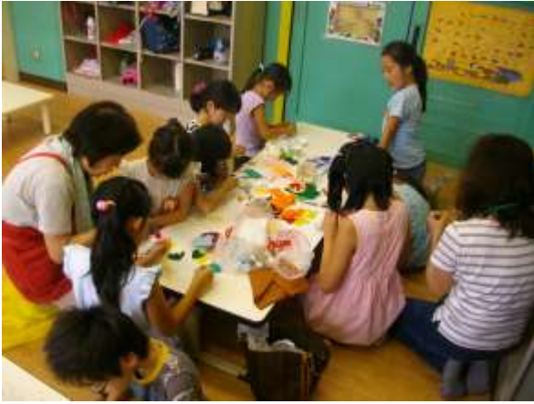
☆ペットボトルキャップ DE マグネット☆