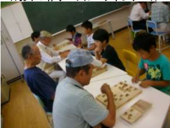
☆はっぴーくらぶさんと囲碁・将棋☆