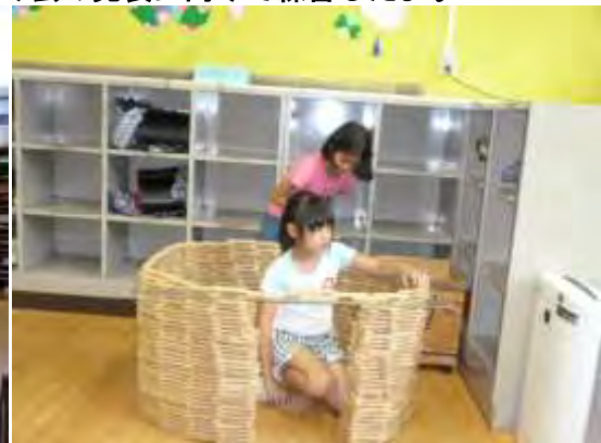
◇キッズクラブのカプラでいろいろなものを作ったよ♪◇