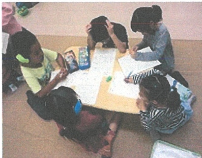
「あ〜、答えはわかるんだけど、めんどくさい〜」 でも、最後までがんばる。 集中するための「ひみつ道具」が人気です。

下校をしてきたら、宿題をする人が多いです。 学年にもよりますが、10分程度です。