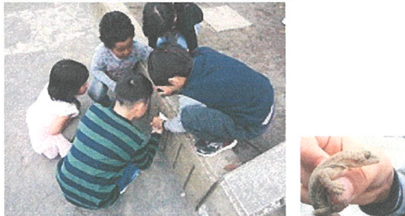
「ヤモリみつけた!」「なまえはね…ヤモくんかな?」