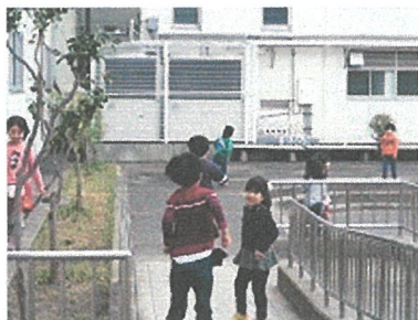
追いかけてっこをしています。「きゃー!にげろ〜」 「つかまえるぞ!!!」