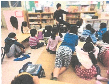
「え〜、そんなことってある?」「なにそれ、おもしろい!」心の声もれつつも、しっかり聞いてくれます。

【写真の掲載について】「キッズクラブニュース」は家庭配布のほか、学校外配布、(公財)よこはまユースのホームページへの掲載もしています。写真掲載を望まれない場合は、キッズクラブへお知らせくださいますようお願いいたします。