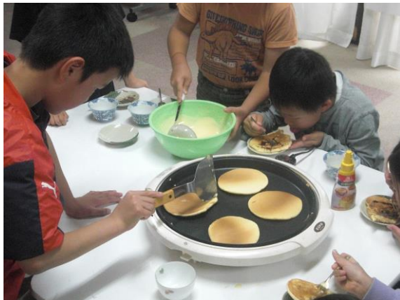
バター（ばたー）をぬ（ぬ）って、チョコ（ちょこ）にケーキ（けい）シロップ（しりっぷ）に… 欲張（よこ）りすぎ（すぎ）です！

パンケーキ（ぱんけい）を作（つく）りました。 みんな上手（じょうず）に焼（や）いていましたよ。