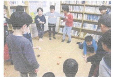
(こままし大会の様子)