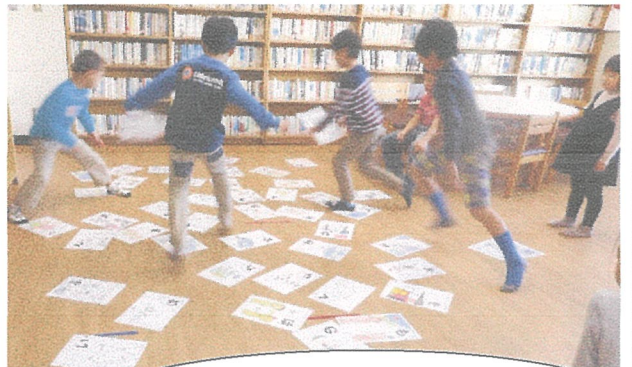
さいきん人気のマンカラ