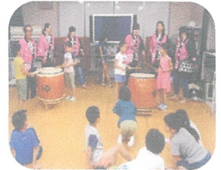
(昨年の和太鼓体験の様子)