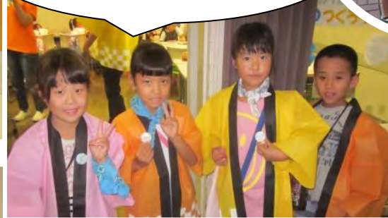
ごみぶんばつゲーム