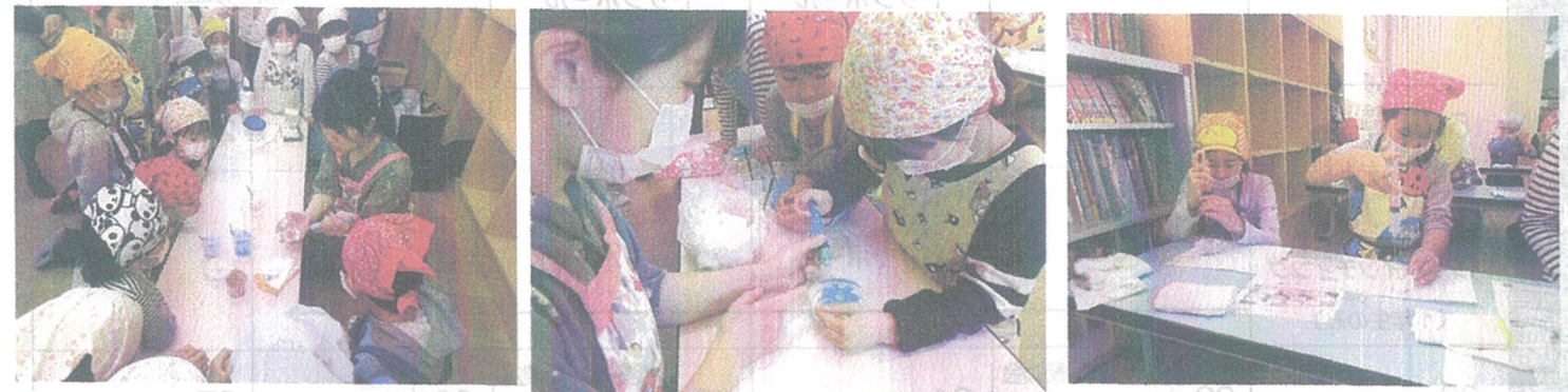
2日 フラワーゼリー作り