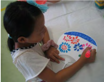
8月9日(火)マイうちわを作ろう