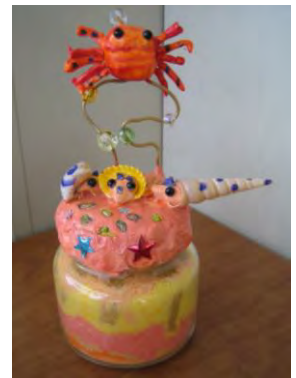
夏のクラフト作品