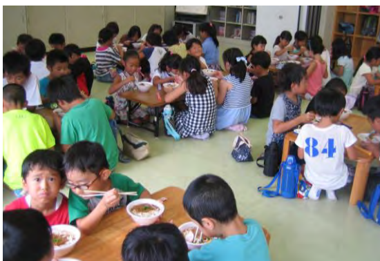
8月24日(水)冷やしきつねうどんを食べよう