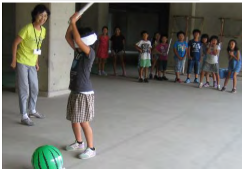
8月18日(木)スイカ割り