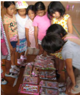
8月23日(火)サプライズじゃんけん大会