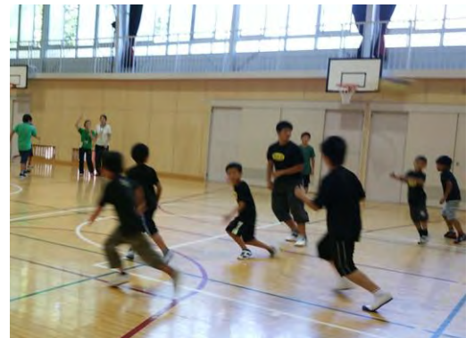
8月4日(木)ドッジボール交流試合