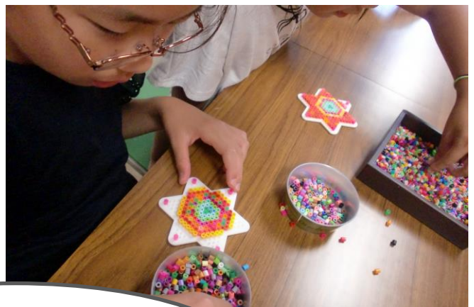
創作クラブ ビーズを並べて、 アイロンの熱でくっつける アイロンビーズを作りました♪