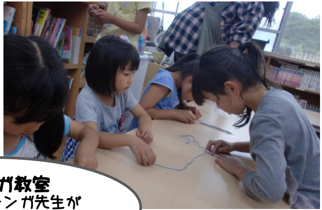
ミサガ教室 上級生のミサガ先生が 1年生にミサガの編み方を 教えてくれました♪