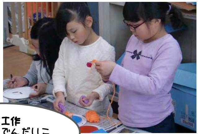
部分工作 オニのでんでんだいこ をつくりました♪