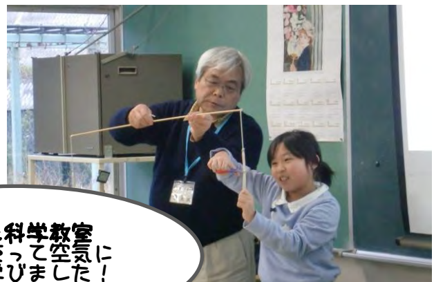
子ども科学教室 風船を使って空気に ついて学びました！