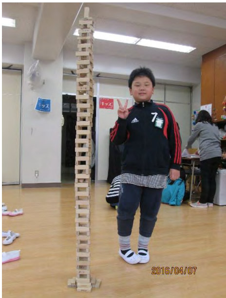
春休みみんなカプラ・ドミノで大作を作った。