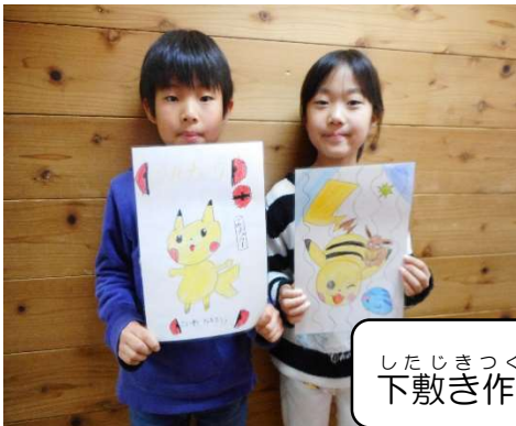
したじきつくりこうさく 下敷き作り工作