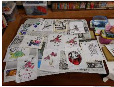
すいぼくがきょうしつ 水墨画教室