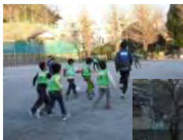
横浜 FC と遊ぼう