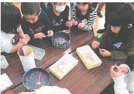
わごむ工作“ファンルーム”