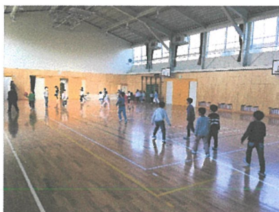
体育館でドッチボール