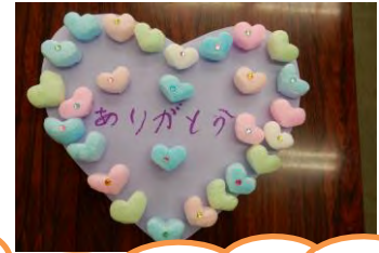
メッセージカードづくり (敬老の日に向けて)