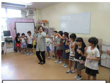
9/13 私達手話ダンス大好きだよ