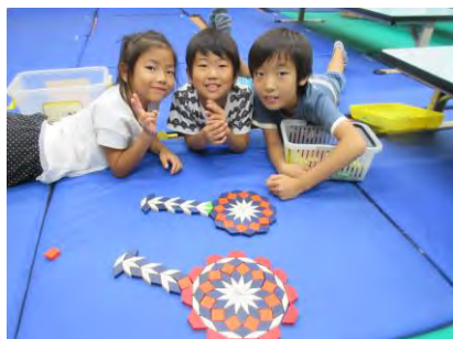
仲良し3人で完成したよ