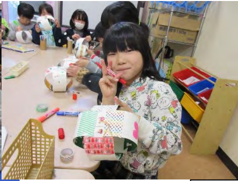
ジャンボヨーヨー作り