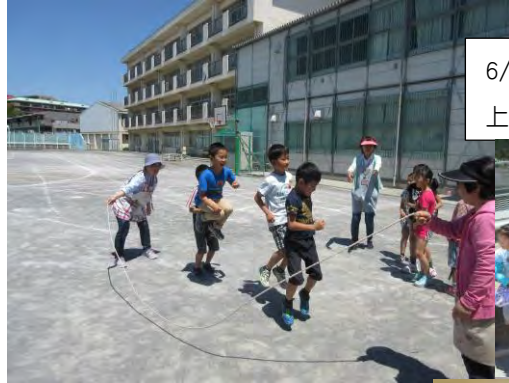
6/2 開港記念日 縄跳び大会 上位 3 位は女の子でした