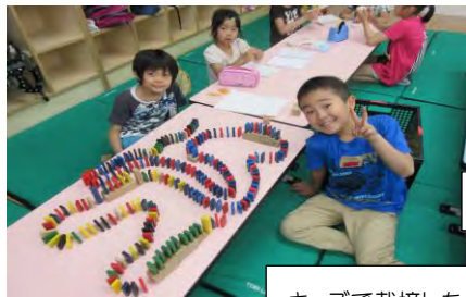
ドミノ完成！今から倒すよ