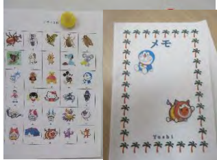
自分の好きなキャラクターと名前をパソコンに入 入してメモ帳作ったよ