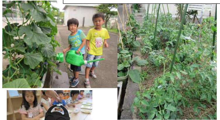
キッズで栽培したキュウリやトマトは新鮮でおいしいよ