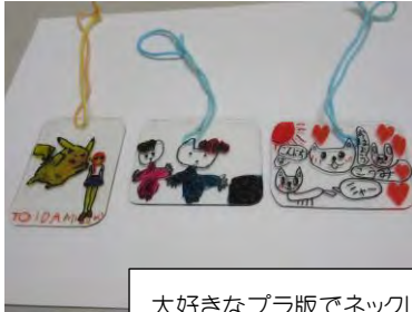
大好きなプラ版でネックレス作成