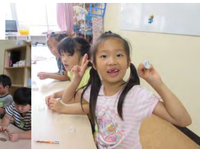
【工作教室】見て！缶バッジ上手にできたよ