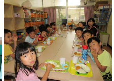
午後 5 時のおやつ時間は楽しい！