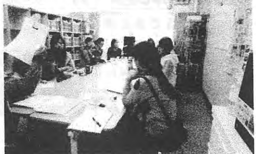
4/11 和気あいあいの保護者会