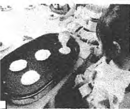
4/18-22 だら焼きを作って食べたよ