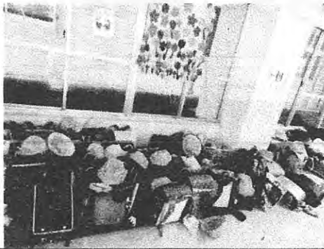
4/18 ランドセル入れも一年生分でこの通り！ びっしり、2年生以上は廊下のシートの上