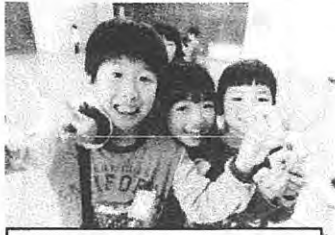
体育館でジャンケンゲーム