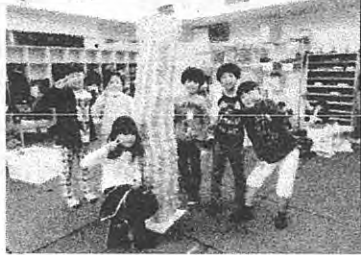
ありったけのカプラ使 い切ってご覧のタワ ーが完成