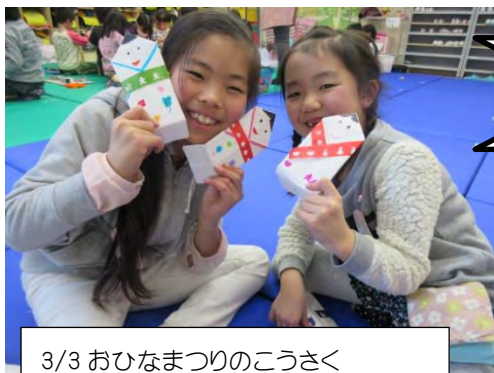
3/3 おひなまつりのこうさく