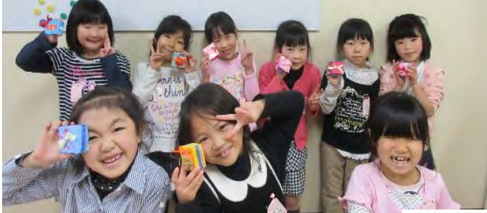
2/12 バレンタインのプレゼント用BOX