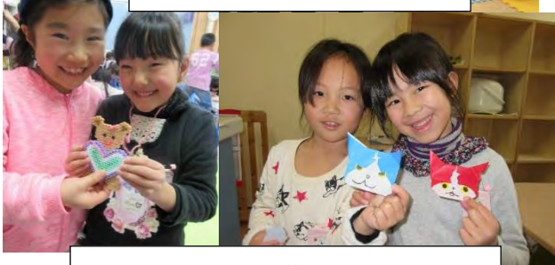
1/28 折り紙教室で「ジバニャン」を折った