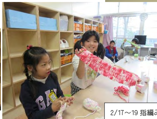
2/17~19 指編みでマフラーにチャレンジ！