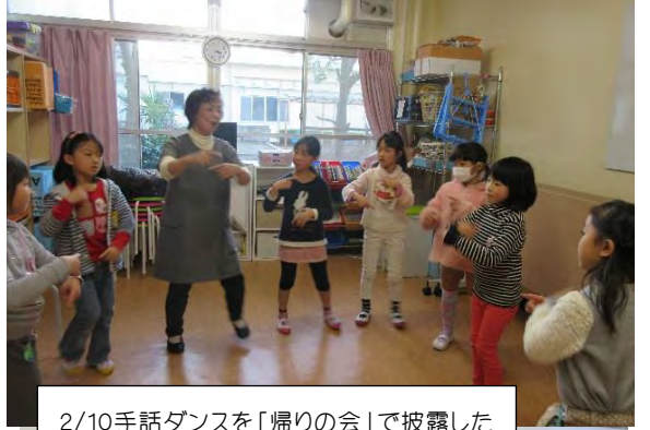
2/10手話ダンスを「帰りの会」で披露した