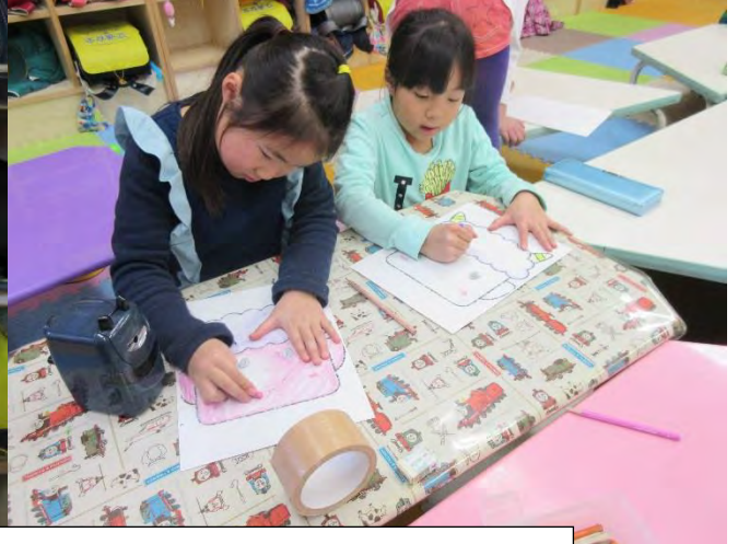
2/3 節分のお面を作り「鬼は外、福は内！」