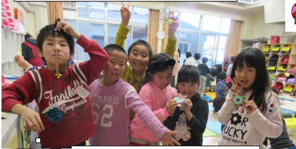
2/1 好きなアイロンビーズ！