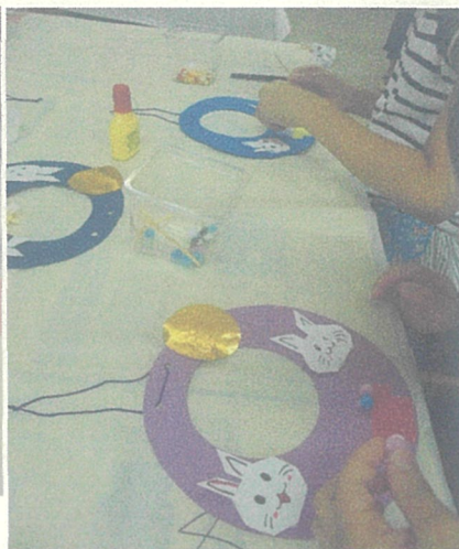
~お月見リース作り~