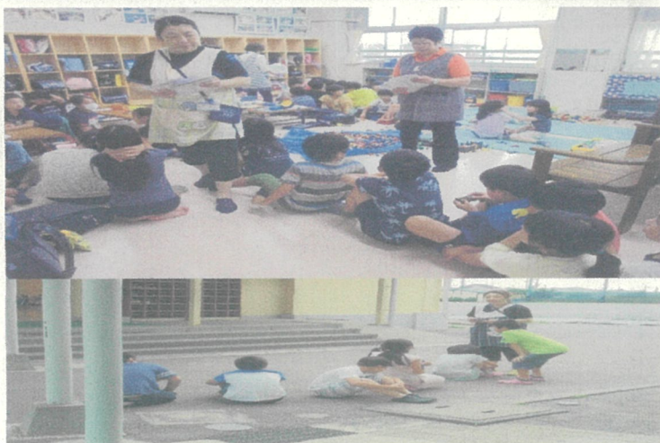
☆避難訓練に協力してくれて、どうもありがとう。

●キッズクラブでは、今後発行の『キッズだより』や、よこはまユースのホームページに活動中の写真が掲載されることがあります。