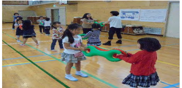
～ 3 B 体操 ～