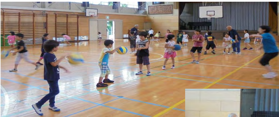
～ ミニバス体験 ～