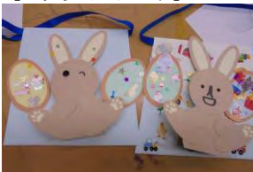
【ステッカーアート】

チョコレート色のうさぎたち。どこかのうさぎ君に似ていますね～ 「ぎゅっ！」とカードを抱きしめています。