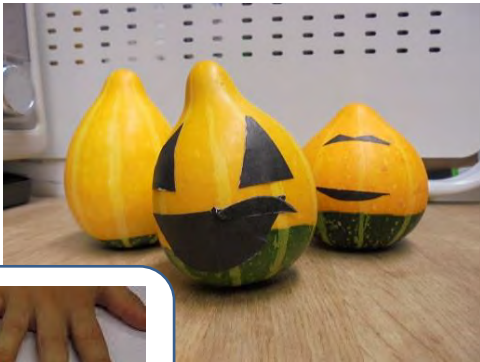
【かぼちゃパーティー】

あっという間にひんやりとして、冬がやってきました。体調を崩す人も増えて、手洗いうがいますます大切な季節に。手拭きハンカチやティッシュの準備をもう一度確認しましょう。大活躍の季節です。