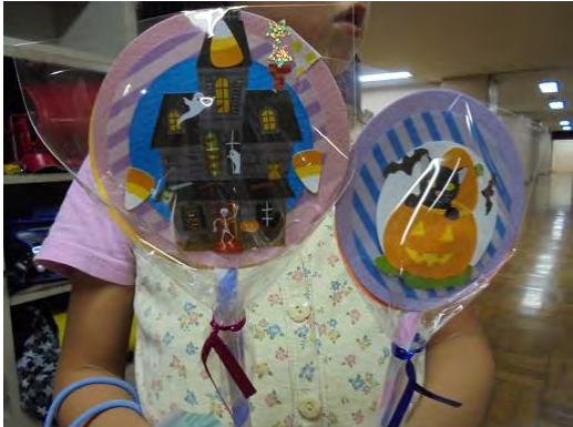
【ステッカーアート〜キャンディスティックカード〜】

暗やみの体育館でプレゼントを集めました。 「あくまのツメ」と「魔法の杖」と「おかし！」 用意をして、案内をして、くばってくれるのは 3年生以上のみなさん。 「仕事があるのもたのしいよ〜」