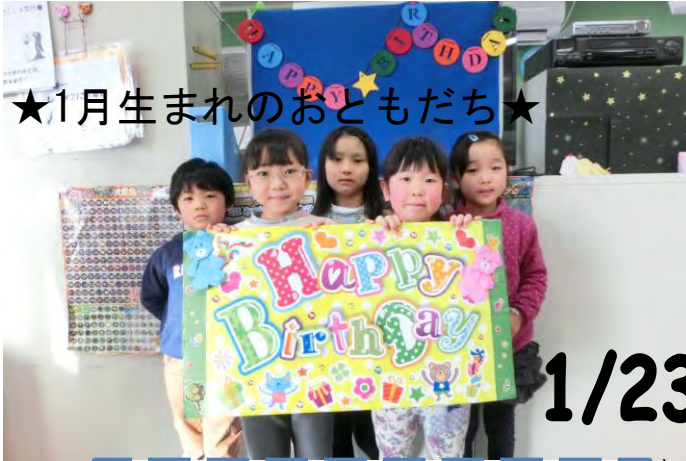
★1月生まれのおともだち★