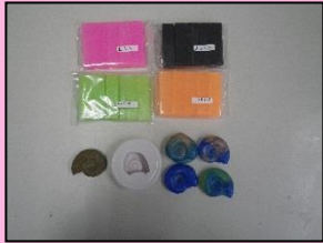
↓ 完成品(マグネット付き)

本物のアンモナイトからとった型で、簡単にレプリカが作れます。キーホルダーやマグネットに加工することもできます。化石探検ツアーや化石クイズを合わせれば、君も化石マスター！