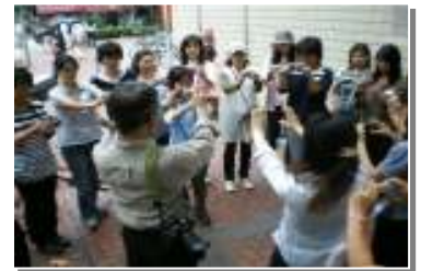
★前回の講座の様子「構え方を学ぶ」★ 普段はどんな風にカメラを構えていますか?

イベントや行事・研修会の様子…子どもたちの表情。 分かりやすく・魅力ある写真で伝えたいです。また、活動や団体の 広報や記録において、写真は効果的に伝える大切なツールです。 誰でもカンタンに使えるデジタルカメラだからこそ、少しコツを 覚えるだけで撮影技術がアップします。 プロの写真家による、分かりやすくポイントをまとめた大人気の 入門講座です。