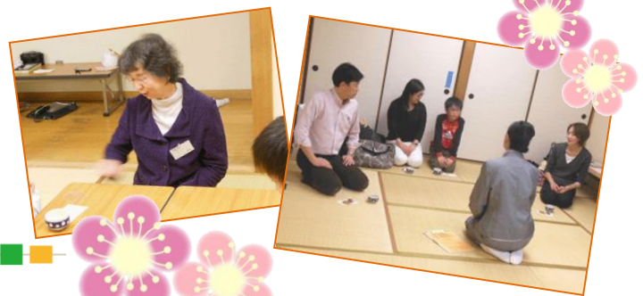
(写真上：日本作法会さん練習風景)

お礼法の基本を身に付けた人の顔つき、表情の美しさは、どんな高価な洋服よりもお化粧よりも比喩ものにならない自然体の美しさがあり、街でそんなお嬢さんを見受けることがあります。基本を身に付けた安心感からくる落ち着きでしょうか。心もやさしいですね。少しでも早く礼法の基本を身に付ける大切さを思います。